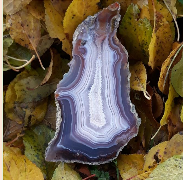
Achat von Toubkal, Marokko / Agate from Toubkal, Morocco. 9 cm.