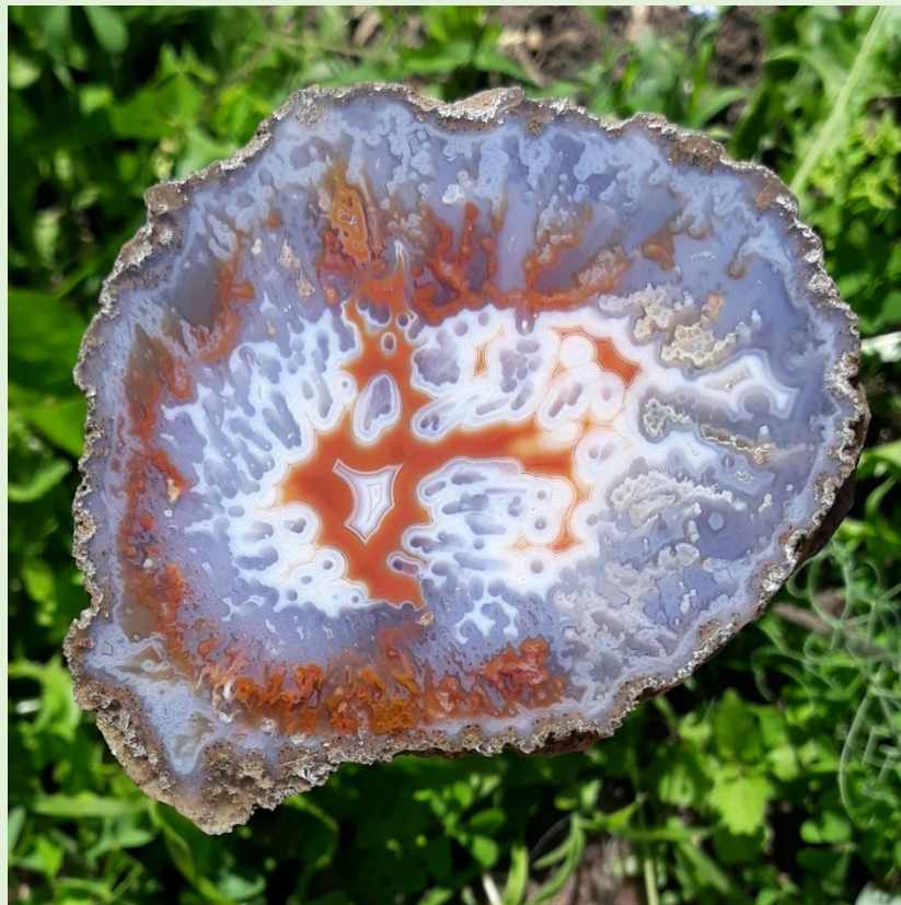
Agouim. 8.5 cm.