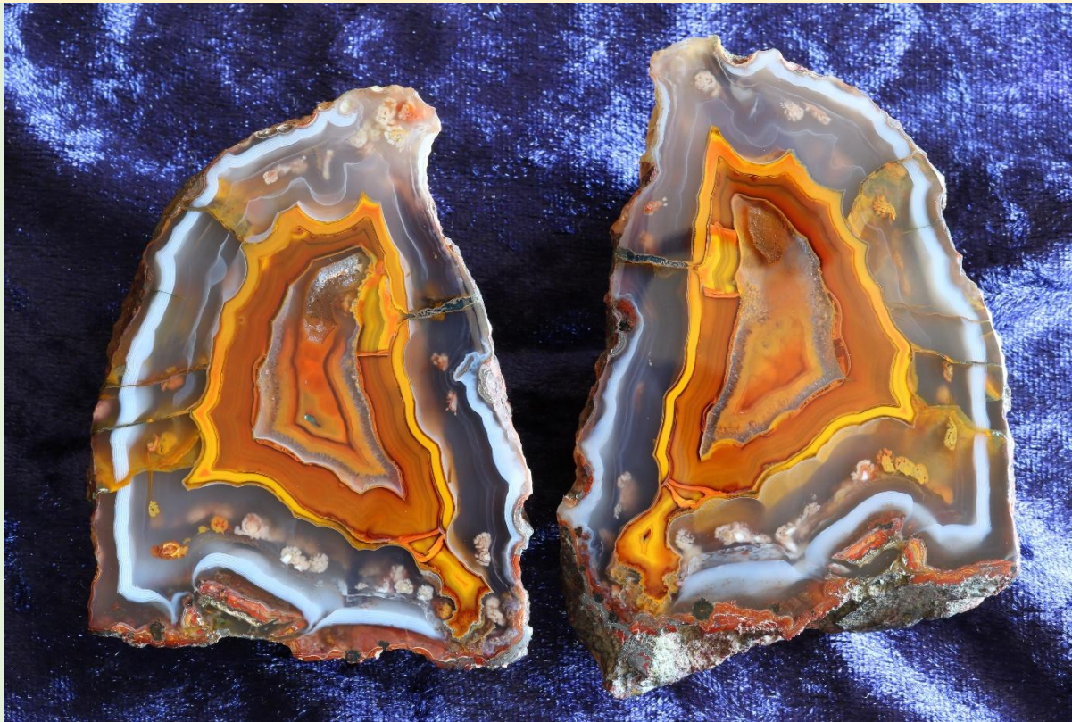
Achat-Pärchen von Toubkal, Marokko / Agate pair from Toubkal, Morocco. 9 cm.