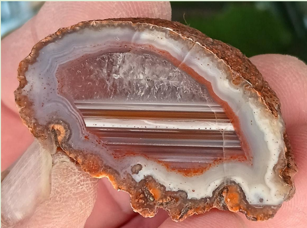
Markante Gravitationsbänderung / Distinct gravitational banding. Freisen. 5 cm.