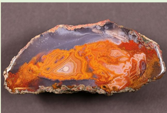
Achat von Toubkal, Marokko / Agate from Toubkal, Morocco. 9 cm.