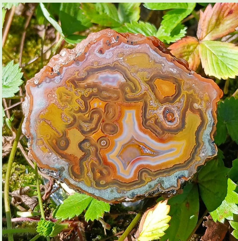
Agouim. 5 cm.