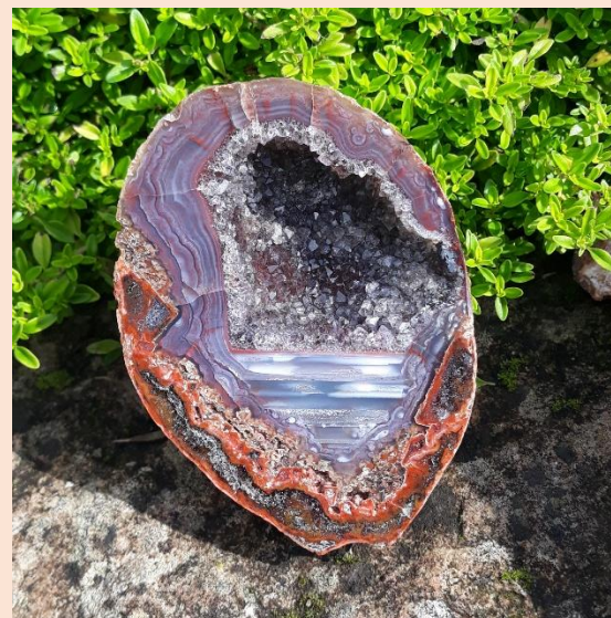
Achat mit funkeln den Quarzkristallen und Gravitationsbänderung von Freisen / Agate with sparkling quartz crystals and gravitational banding. Freisen, Germany. 9.5 cm.