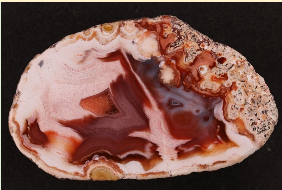
Achat mit Chromatographiephänomen / Agate with chromatography. Freisen. 6 cm.

He is responsible for cutting the rough stones in the Kleinmann-Bartel success team. This is his particular passion. Finding the right cutting direction is a challenge, especially with the crack-prone porcelain agates from Freisen, and requires a great deal of meticulousness and expertise. The first glance at a beautiful agate after a good cut then compensates for the effort.