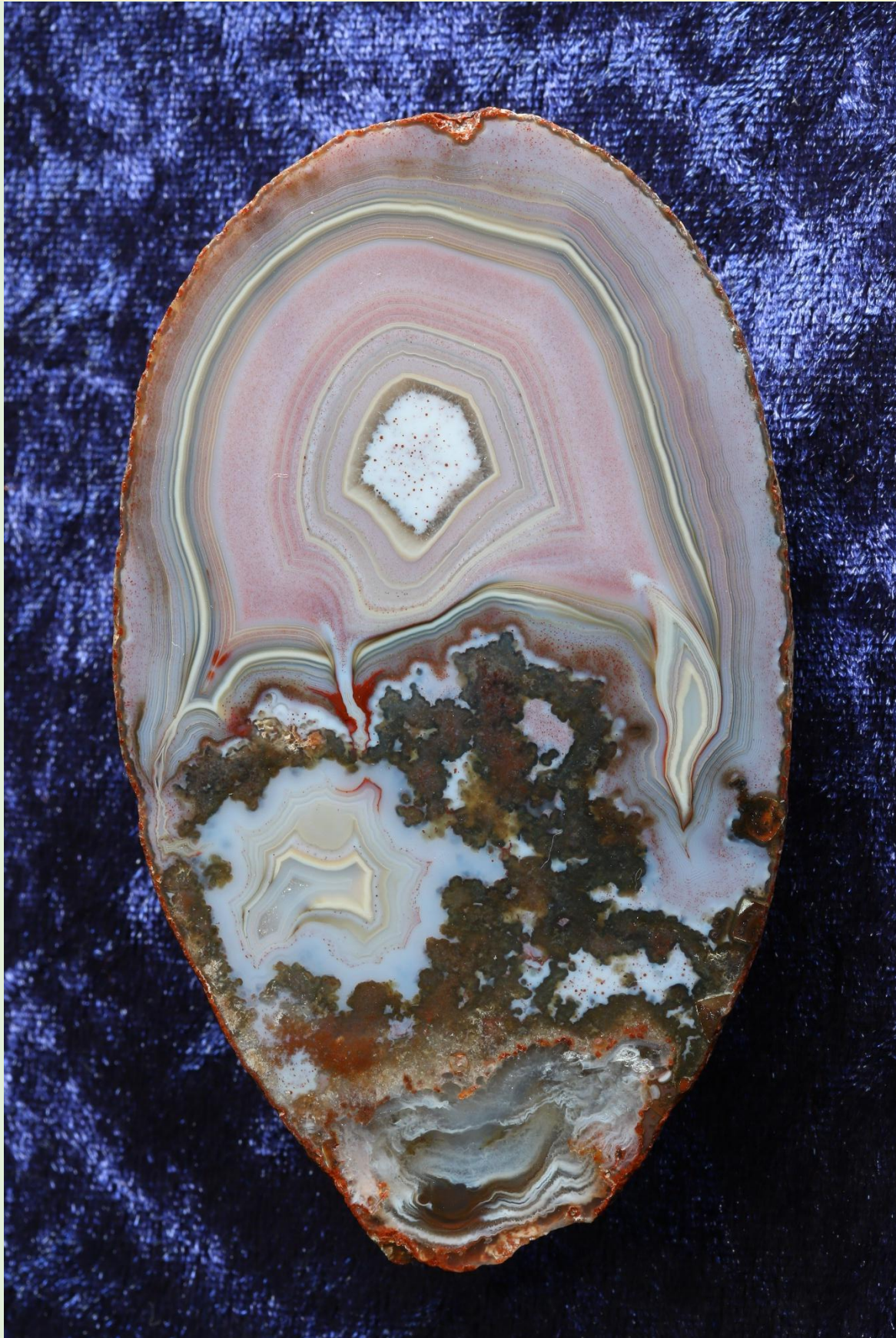
Top-Achat von Freisen / High grade agate from Freisen. 10.5 cm.