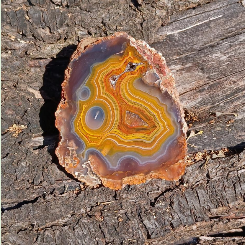
Agouim. 7.5 cm.