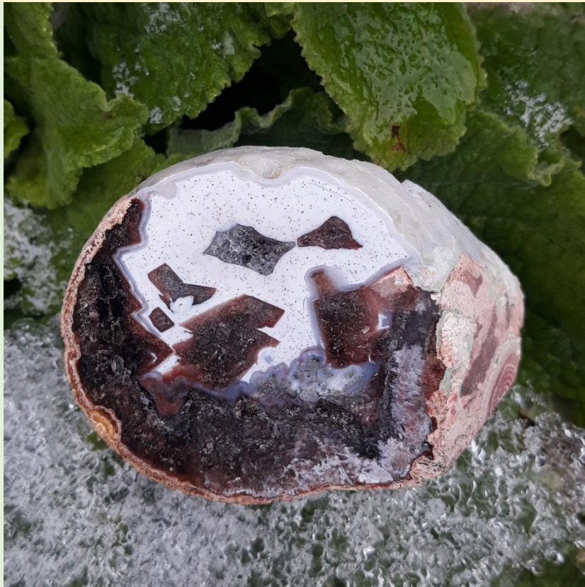
Pseudomorphosen / Pseudomorfs. Freisen. 4.5 cm.