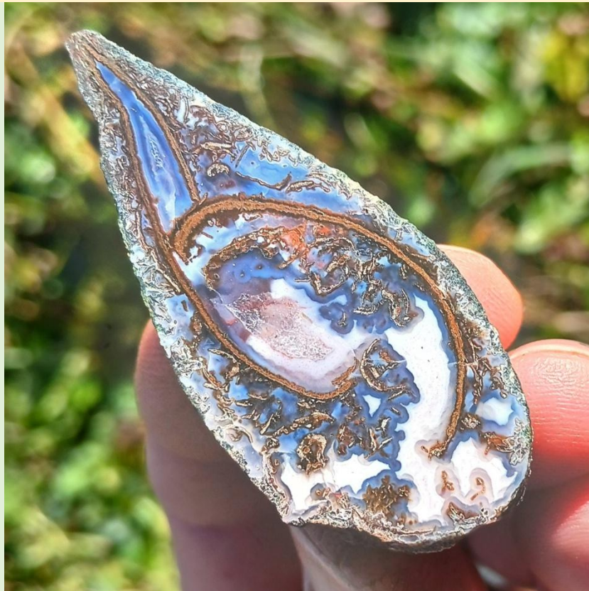
Membranrümmerstruktur / Fragmented membrane structure. Freisen. 5.5 cm.