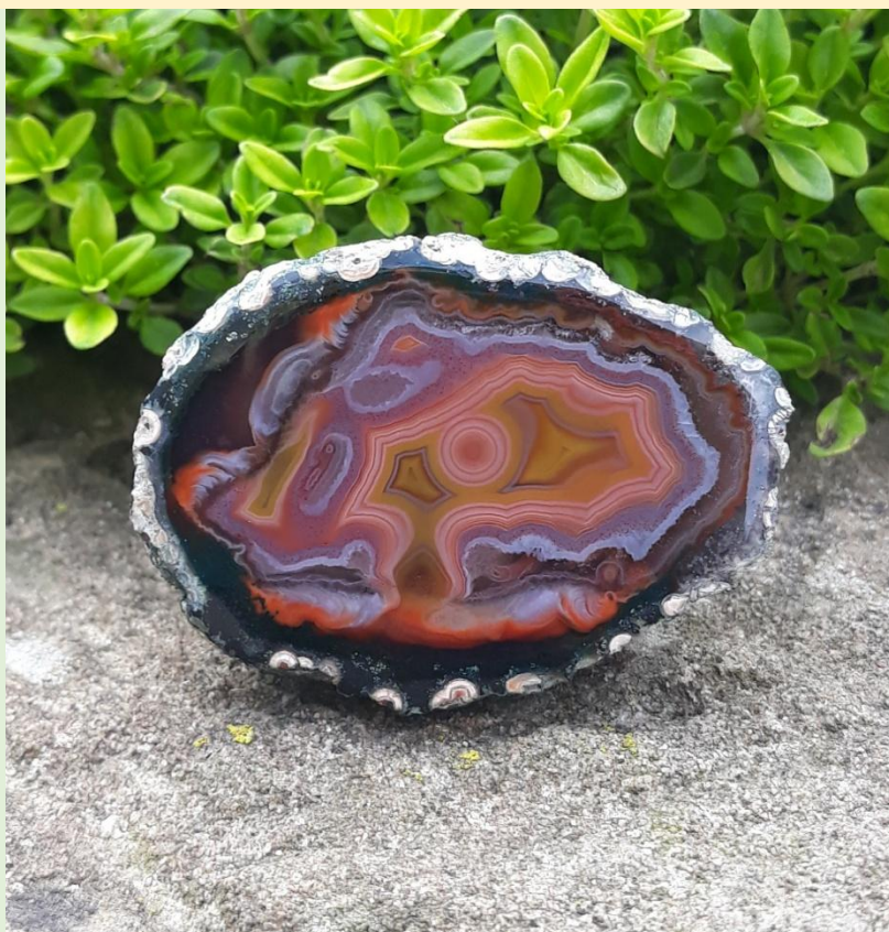
Toubkal. 5 cm.