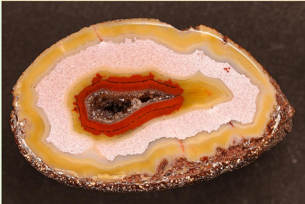
Chromatographie-Phänomen im Zentrum / Chromatography. Freisen. 5 cm.