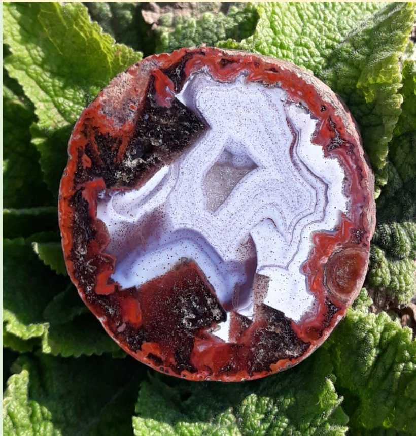
Pseudomorphosen / Pseudomorfs. Freisen. 5 cm.