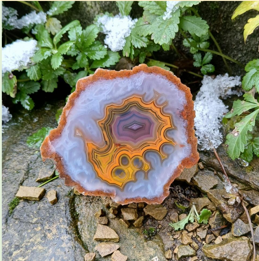
Farbenprächtiges Zentrum / Extremely colourful center. Agouim. 7.5 cm.