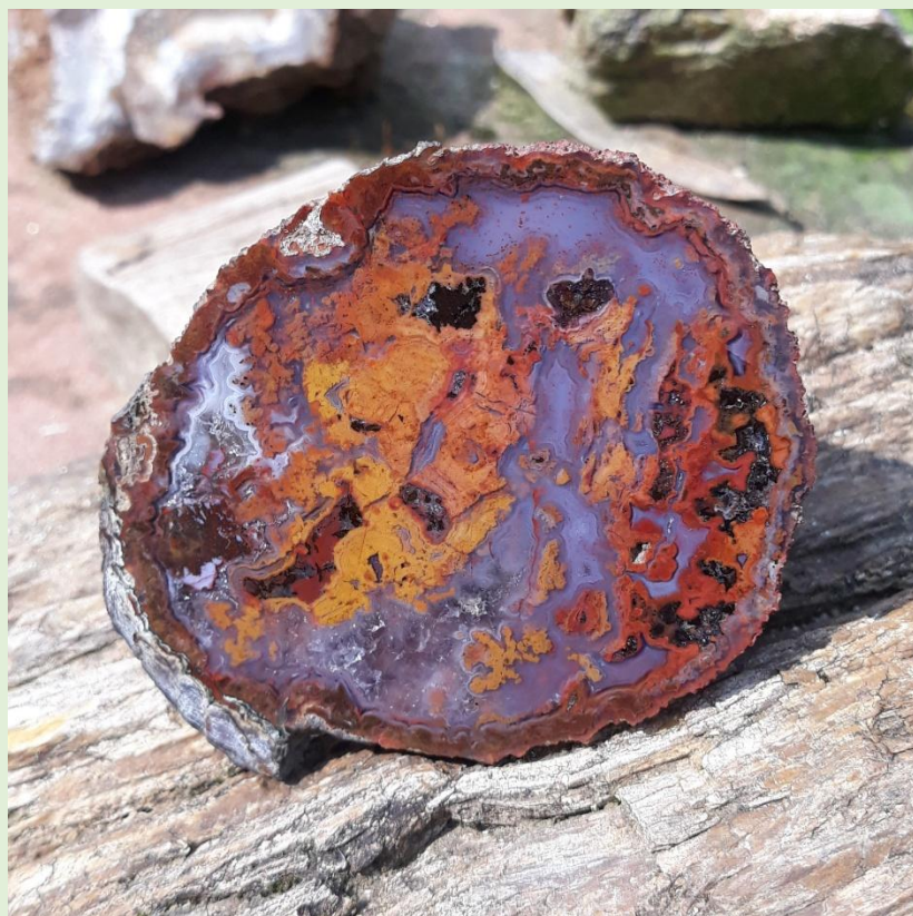
Ungewöhnliche Einschlüsse / Unusual inclusions. Freisen. 7.5 cm.