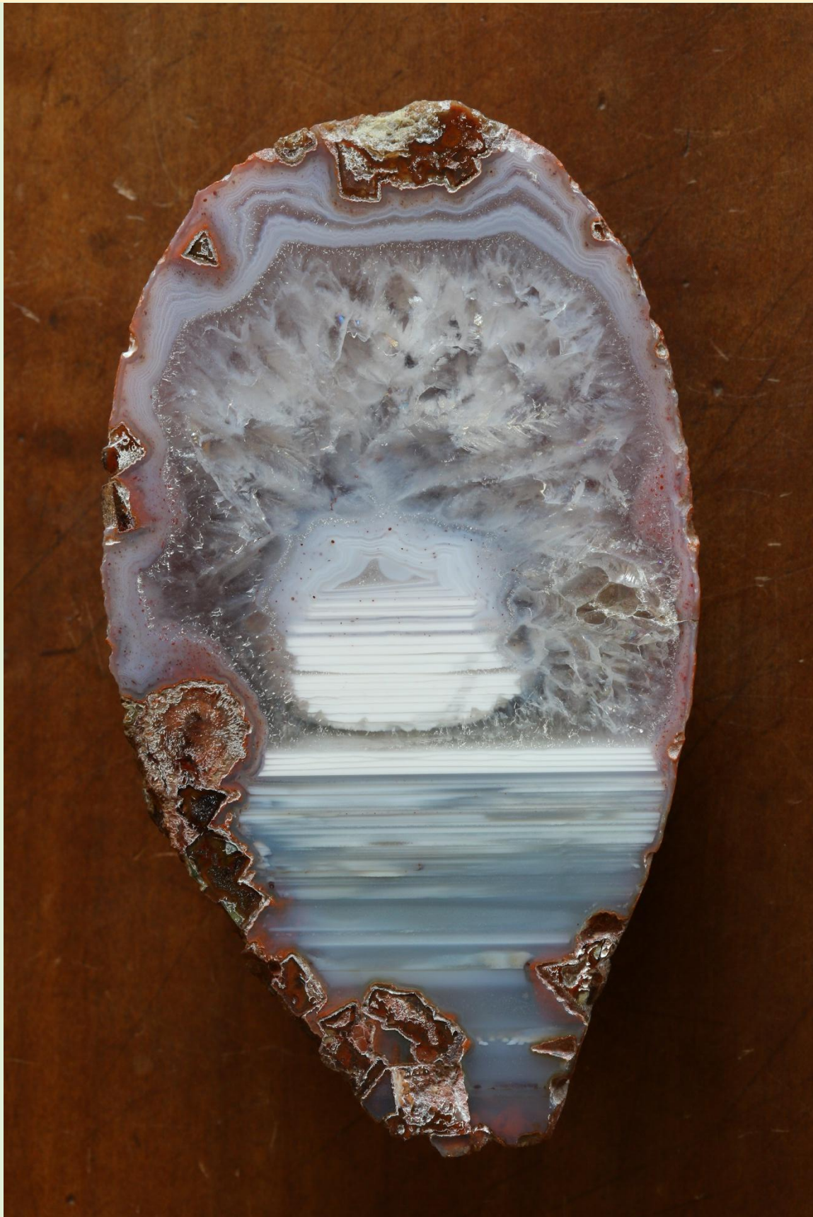
“Doppelte” Gravitationsbänderung / „Double“ gravitational banding. Freisen. 8.5 cm.