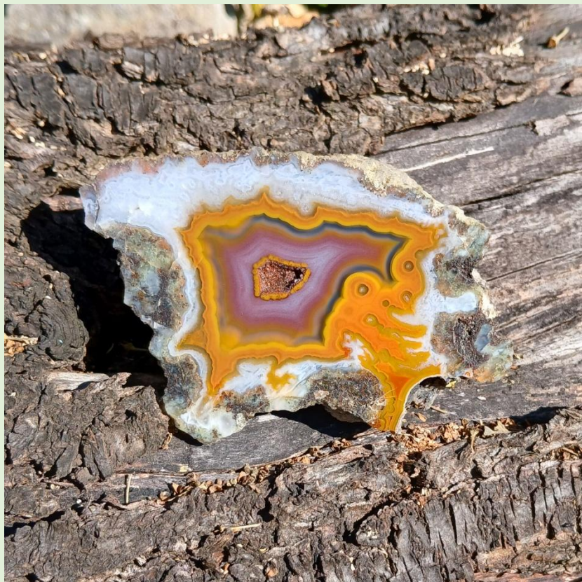
Agouim. 9 cm.