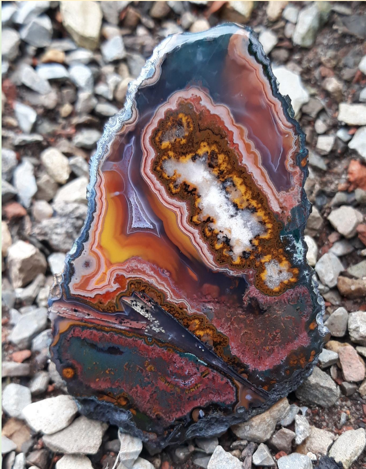
Überaus komplexe Texturen. Achat von Toubkal, Marokko / Extremely complex textures. Agate from Toubkal, Morocco. 6 cm.