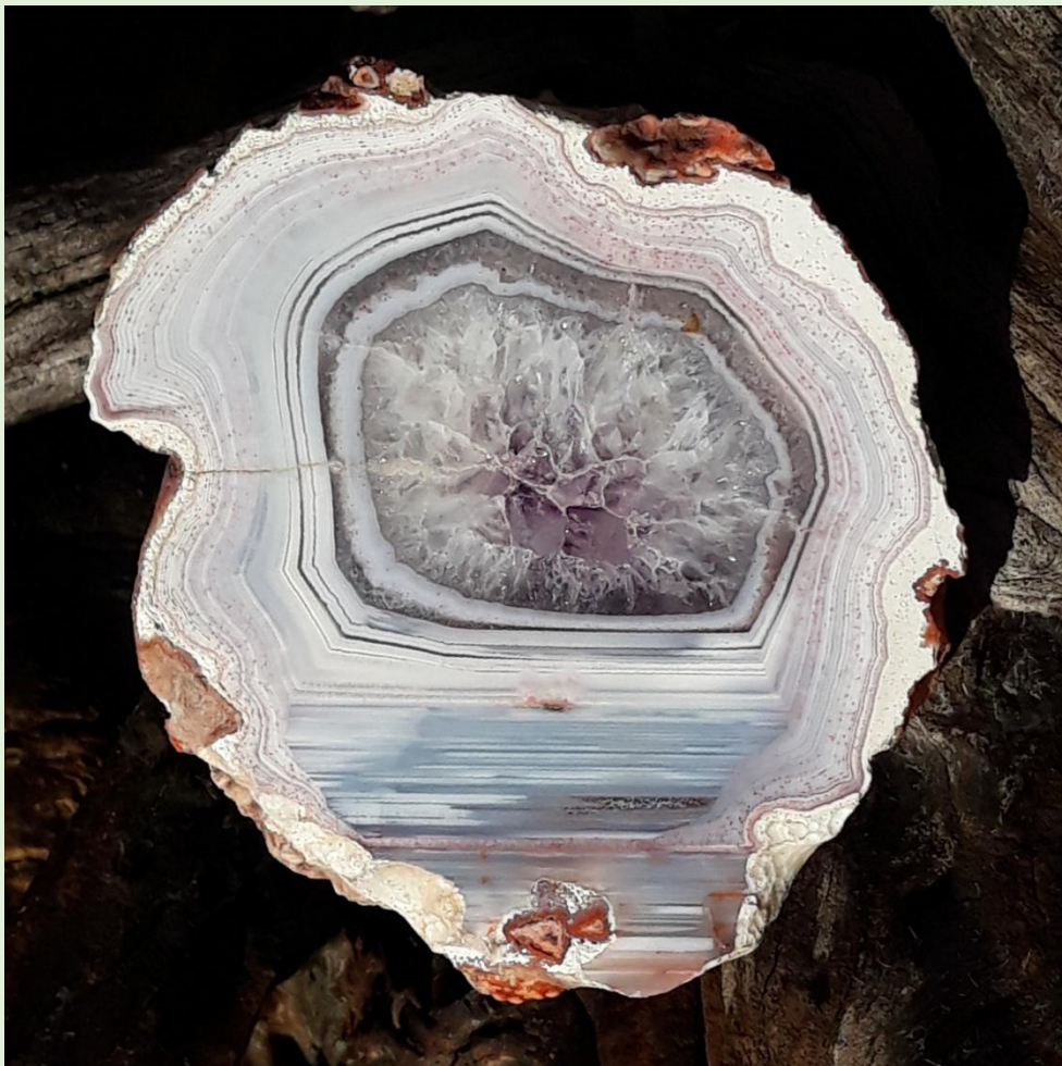
Seltenes Amethyst-Zentrum / Rare Amethyst center. Freisen. 7 cm.