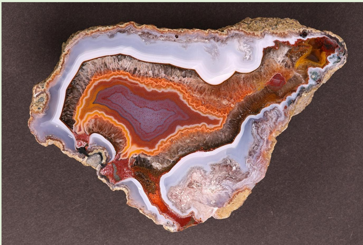
Isoliertes Zentrum / Suspended center. Toubkal. 11 cm.