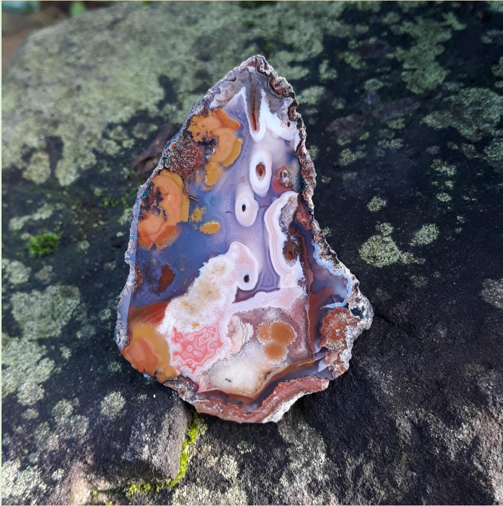
Röhrenstrukturen / Agate with tubes. Toubkal. 8.5 cm.