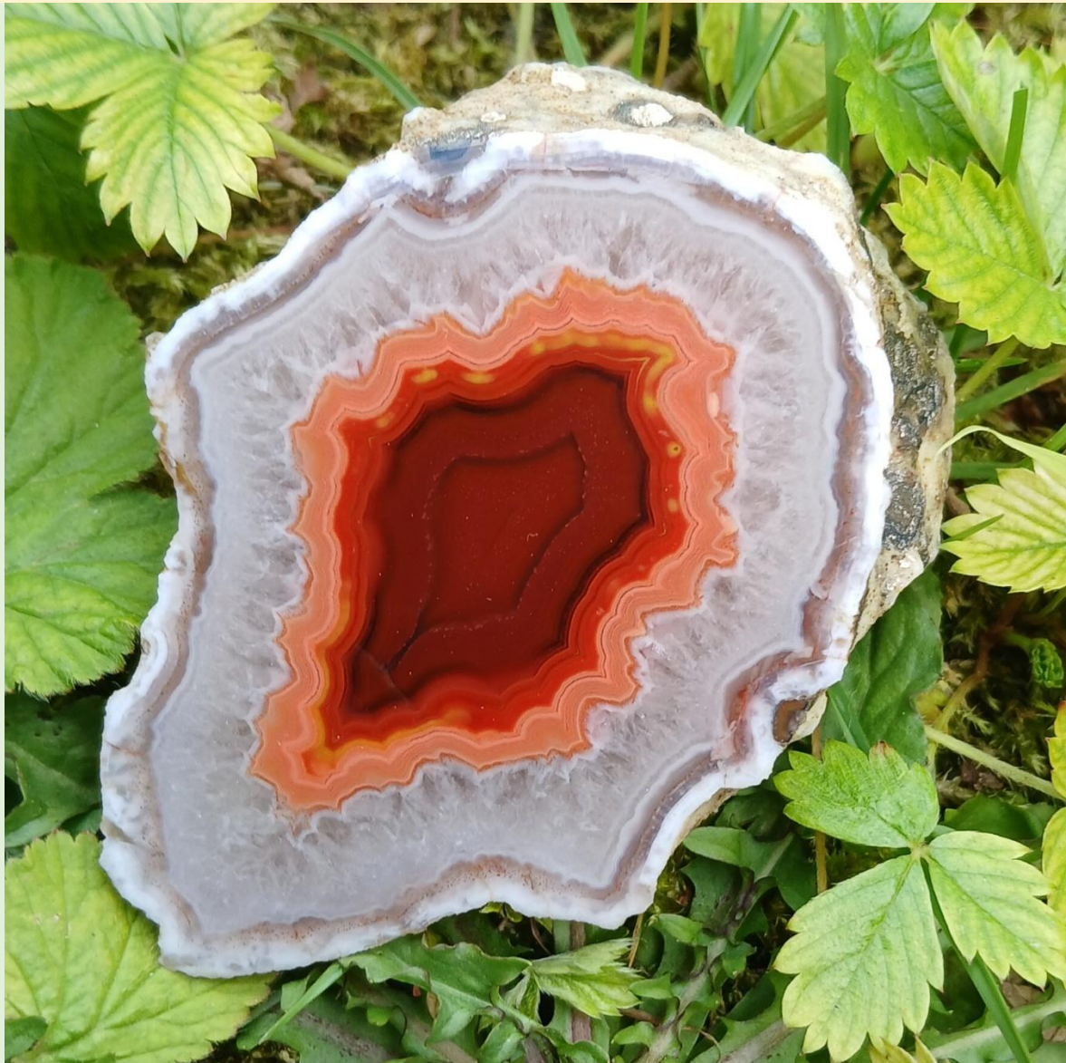
Isoliertes Zentrum / Suspended center. Aouli. 7.5 cm.

Sämtliche abgebildeten Achate sind Eigenfunde von Sabine Kleinmann und Helmut Bartel und wurden von ihnen auch selbst geschnitten und geschliffen.