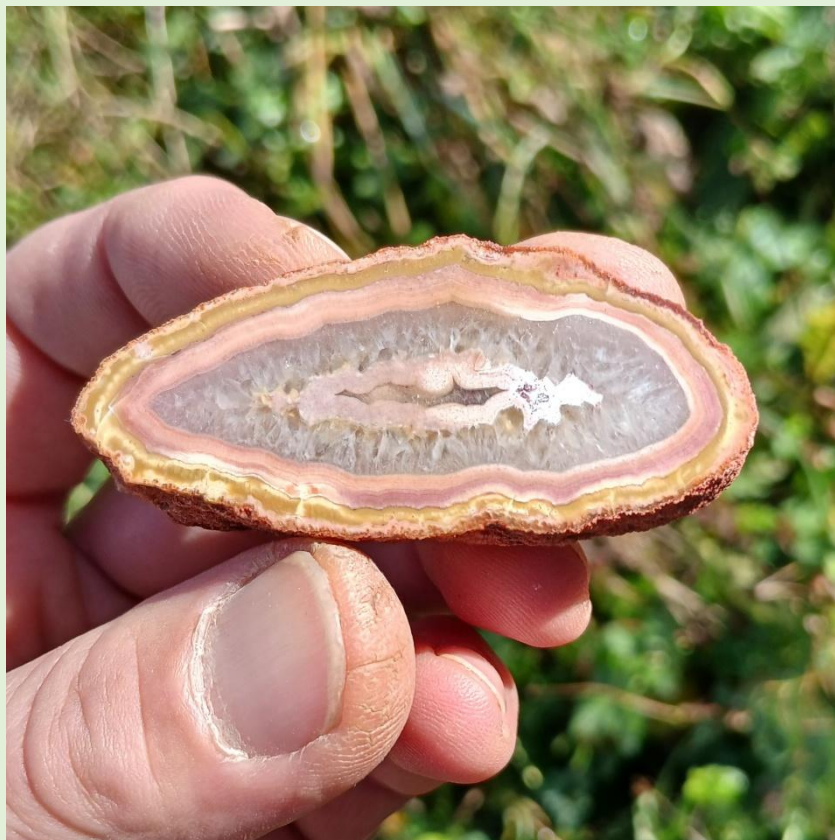
Isoliertes Zentrum / Suspended center. Freisen. 5.5 cm.