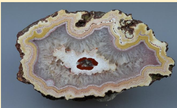
Achat mit einem „isolierten Zentrum“ / Agate with a suspended center. Freisen. 7 cm.

Ihre Begeisterung für Achte weckte auch das Interesse, die schönen Steine nicht nur selber zu suchen und abzubauen, sondern auch entsprechend zu bearbeiten. Ein Schleifkurs in Idar-Oberstein brachte wichtige grundlegende Kenntnisse und Fertigkeiten, um nun die selbst gefundenen Achte zu schleifen und auch zu wunderschönen Cabochons bzw. mitunter zu fertigen Schmuckstücken weiter zu verarbeiten. Besondere Zufriedenheit entsteht, wenn es gelungen ist, nach einem aufwändigen Schleif- und Verarbeitungsprozess die ganze Schönheit eines Steines wunderbar in Szene gesetzt zu haben.