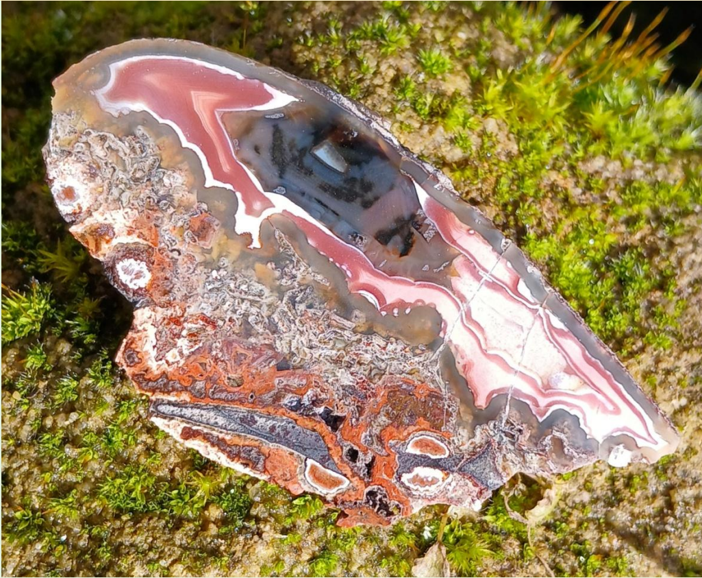
Eine der sehr flachen, aber wunderschön gezeichneten Mandeln / One of the very flat nodules with beautiful pattern. Freisen. 6.5 cm.