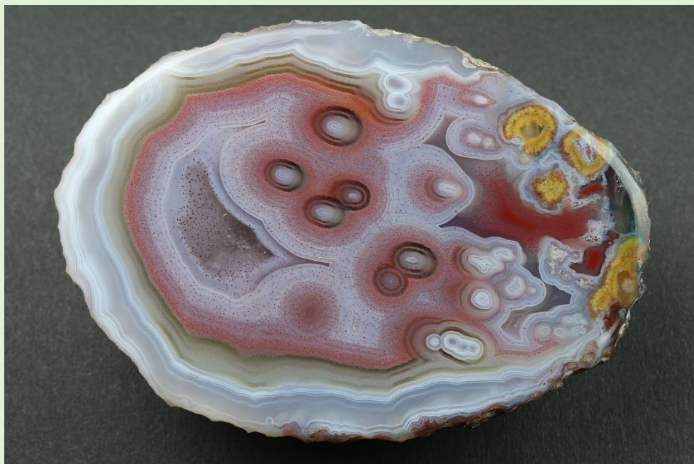
Toubkal. 7 cm.