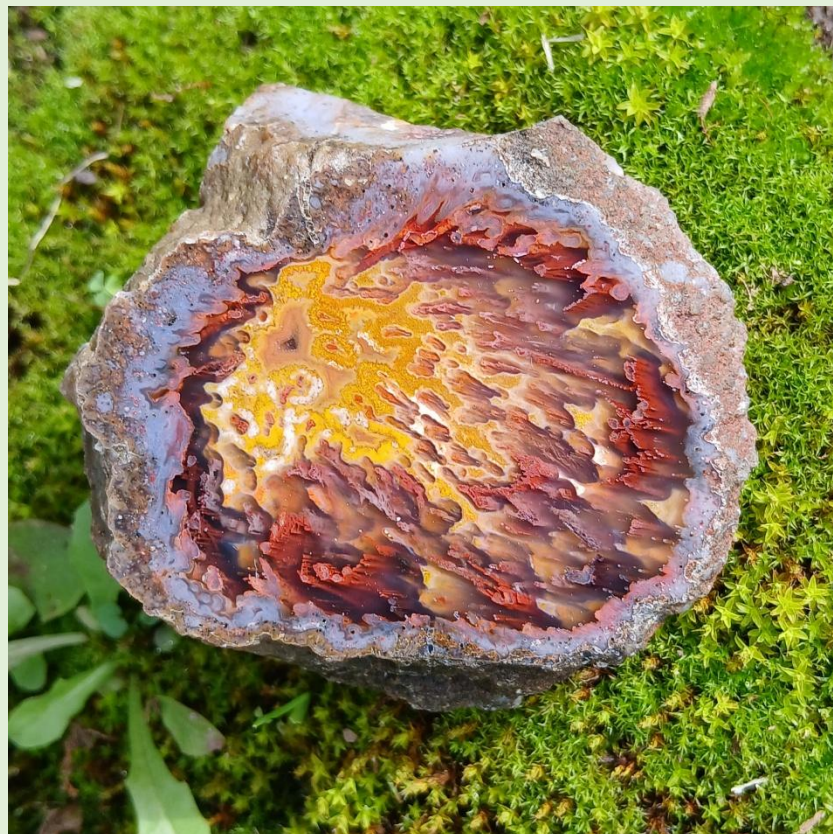
Intensive Röhrenstrukturen / Tube agate. Agouim. 8.5 cm.