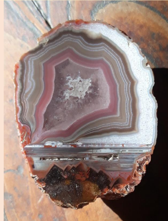
Achat vom eigenen Claim bei Freisen / Agate from their own claim near Freisen. 5 cm.