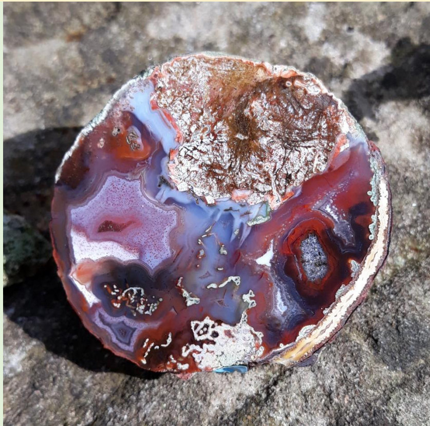
Überaus Komplexe Muster / Extremely complex patterns. Freisen. 4.5 cm.