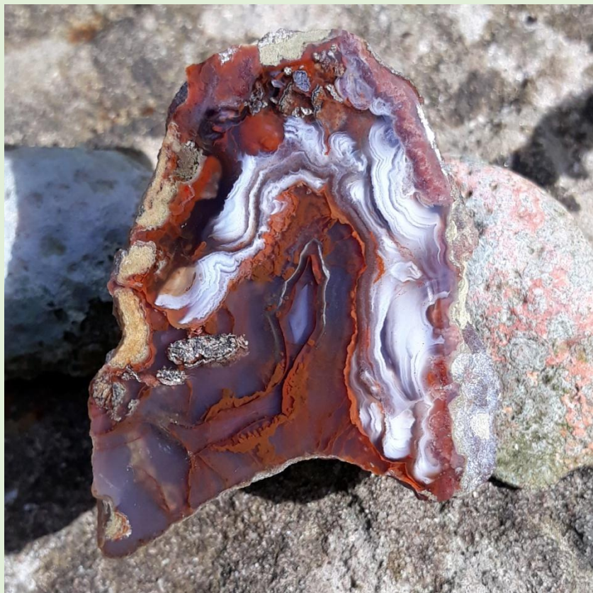
Wolkentexturen /Cloud textures. Freisen. 4 cm.