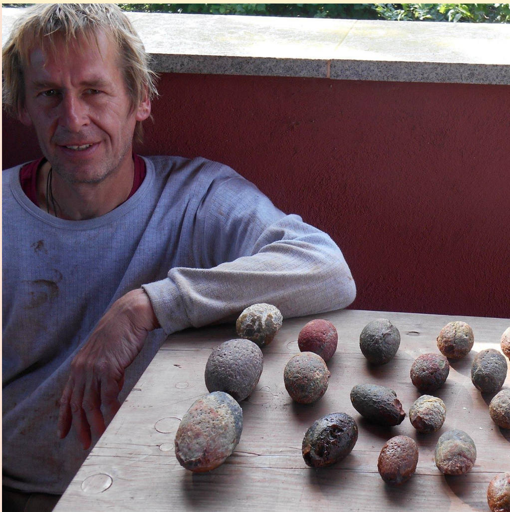
Rohachate aus Freisen, darunter auch das auf Seite 7 abgebildete Stück / Rough agate nodules from Freisen including the specimen from page 7.

http://www.agates.click/media/files/toubkal-asni.pdf