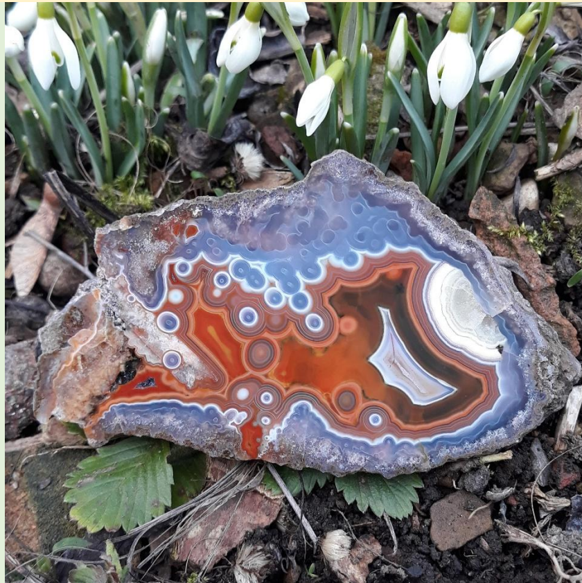
Achat von Agouim, Marokko / Agate from Agouim, Morocco. 11 cm.