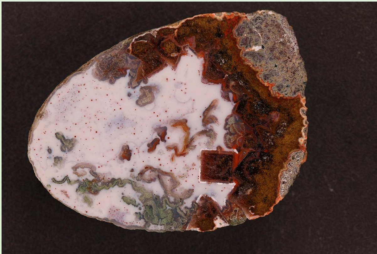
Pseudomorphosen / Pseudomorphs. Freisen. 6 cm.