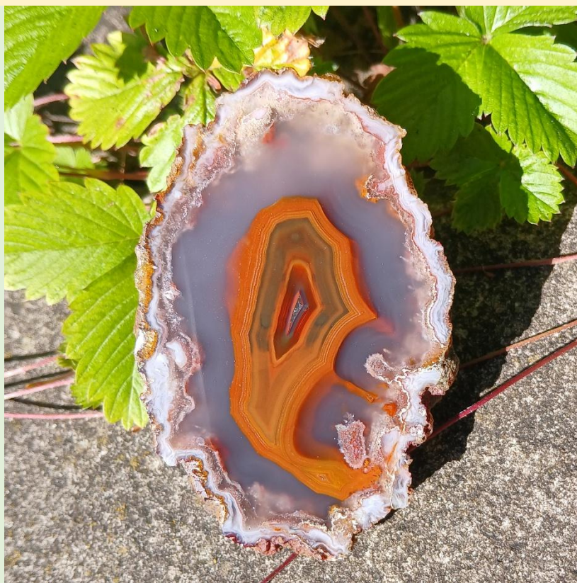
Agouim. 8.5 cm.