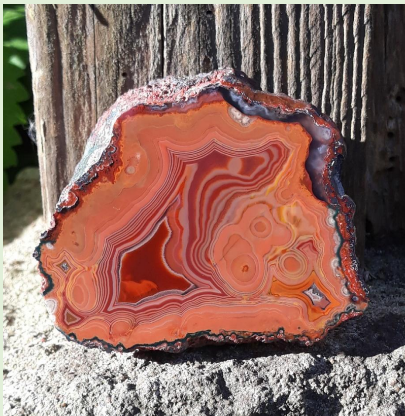
Toubkal. 8 cm.