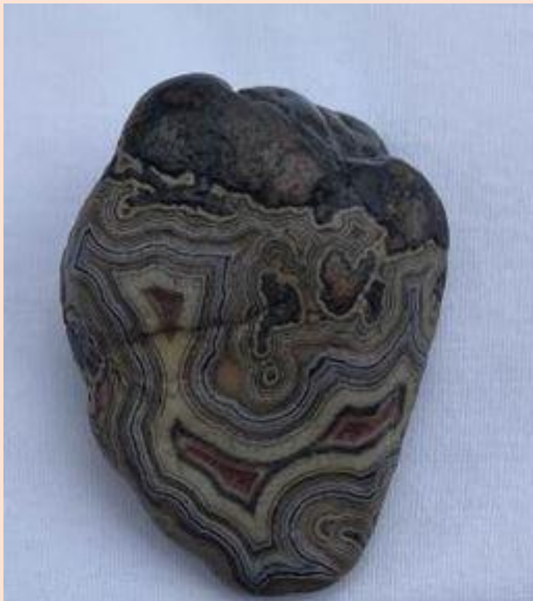
Kern Beds, Fairburn, South Dakota. 6.5 cm.