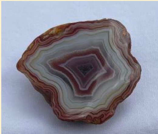
Kern Beds, Fairburn, South Dakota. 5.5 cm.

Wayne Shortridge wird im November 2022 90 Jahre alt und lebt in Fort Collins in Colorado.