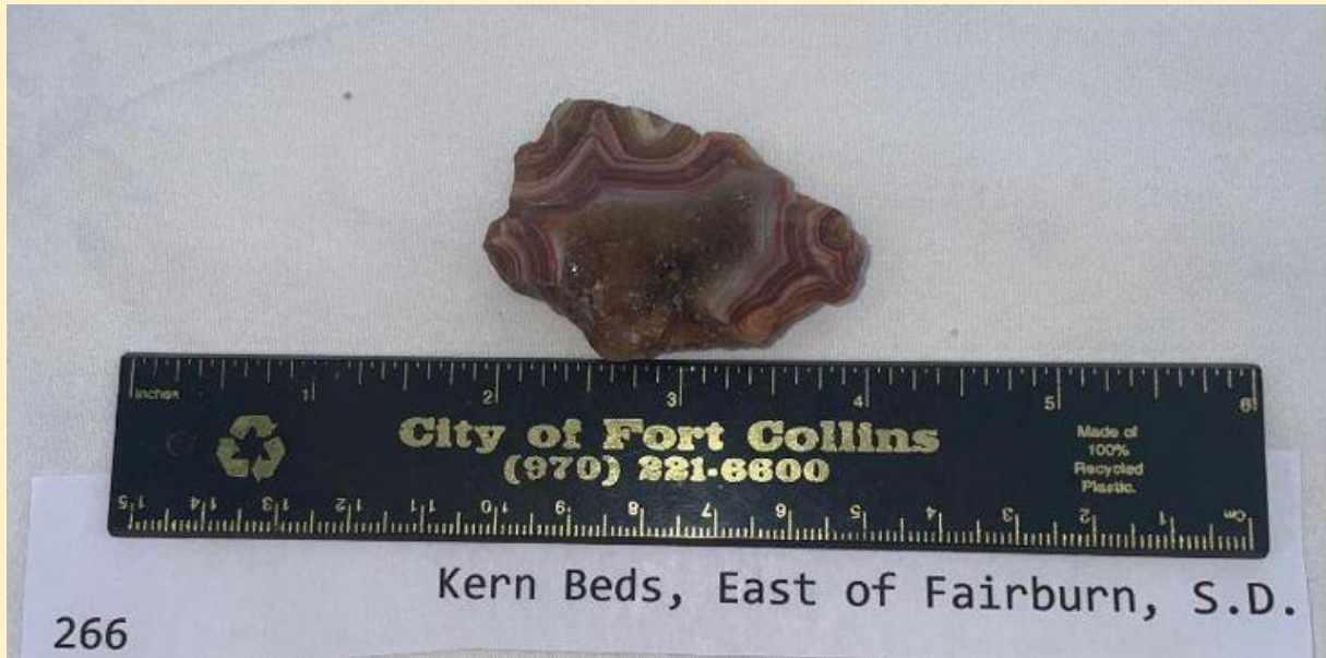
Kern Beds, Fairburn, South Dakota. 5.5 cm.