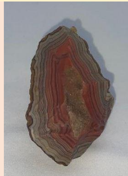
Kern Beds, östlich von / East of Fairburn, South Dakota. 6.5 cm.

There is also a collector's portrait of him in the book Agates II (Johann Zenz).