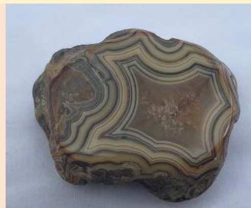
Kern Beds, Fairburn, South Dakota. 6 cm. Wayne Shortridge collection & photo.