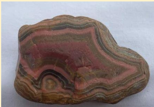
Kern Beds, Fairburn, South Dakota. 7 cm.