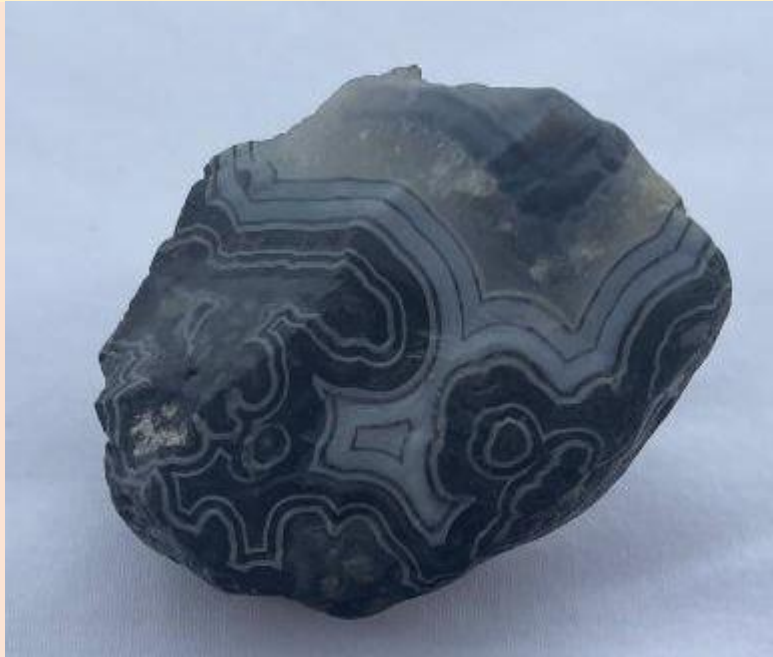
Red Shirt Basin, South Dakota. 6.5 cm.