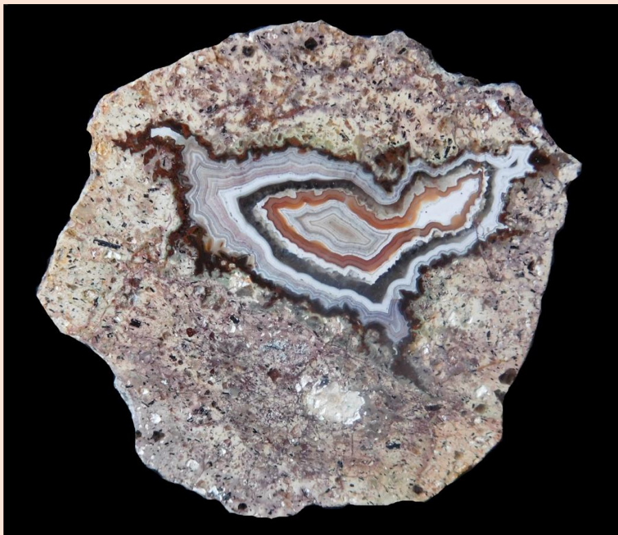
6.5 cm.