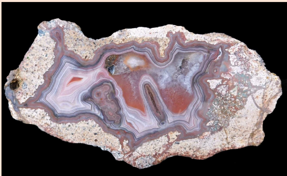
20.5 cm.