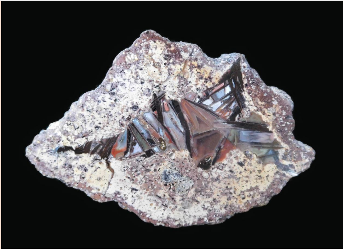
9 cm.