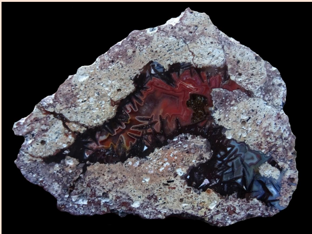
12 cm.