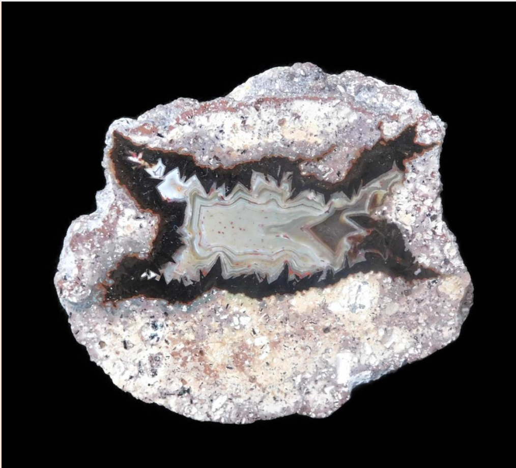
7.5 cm.