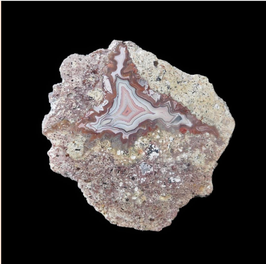
8 cm.