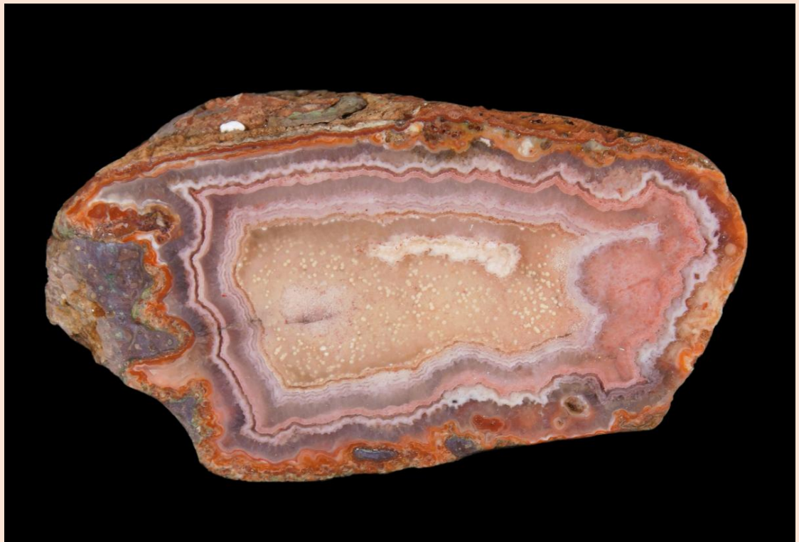
10.5 cm.