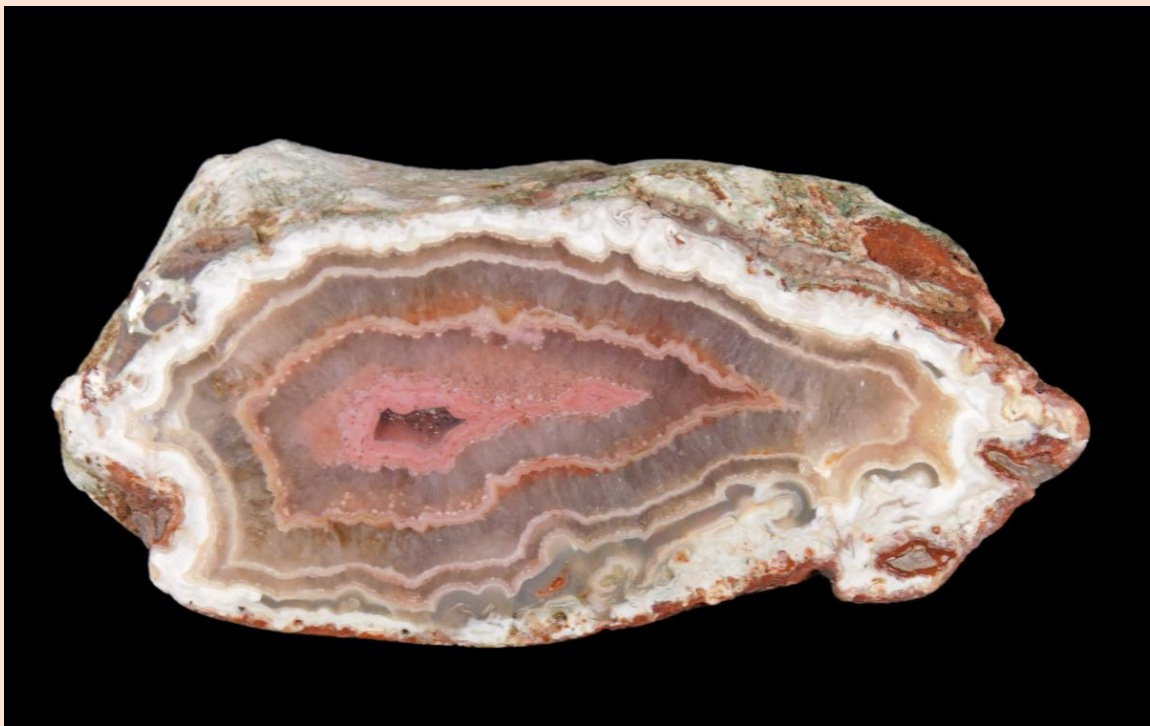
11 cm.