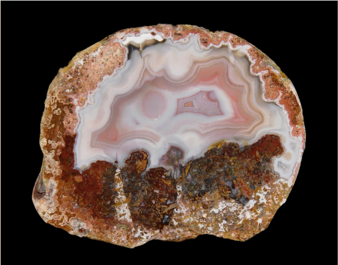
8.2 cm.