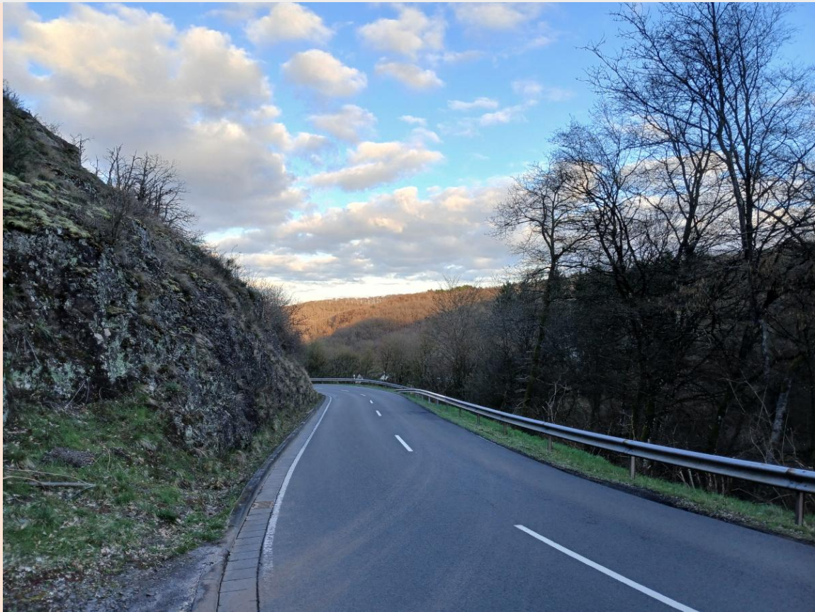
Blick vom westlichen Ortsende von Hintertiefenbach auf das Achat führende Waldstück / View from the outskirts of Hintertiefenbach to the wooded agate site.