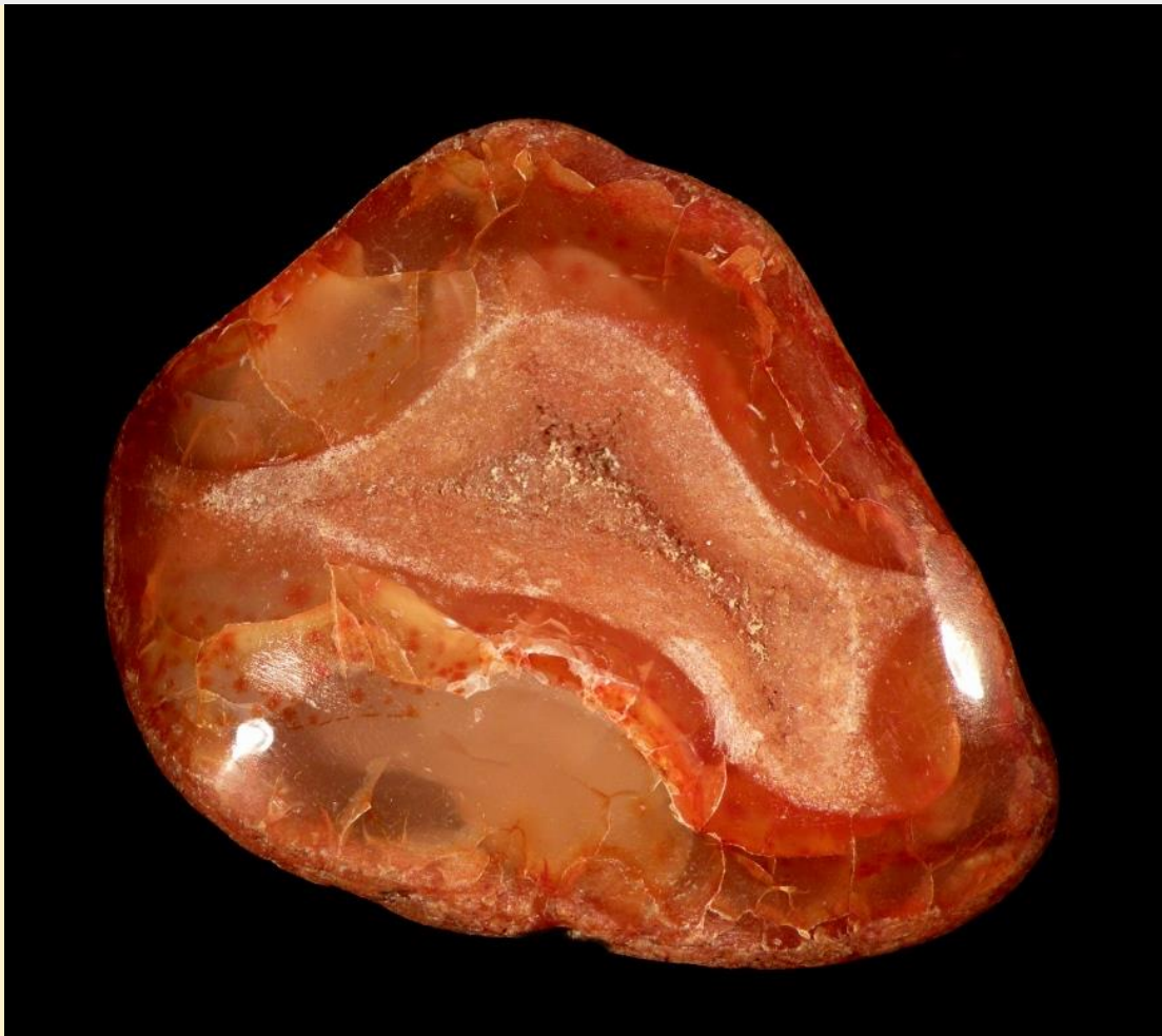
Drummond Agate Beds, Lebanon, Oregon. 7 cm.

This is the name for agate / chalcedony with an orange-yellow to orange-brown color. This occurs rarely in nature, so most of the available carnelians are heat treated in order to achieve a more intense color. The main sources of carnelian are in India, they have been commercially mined for centuries.