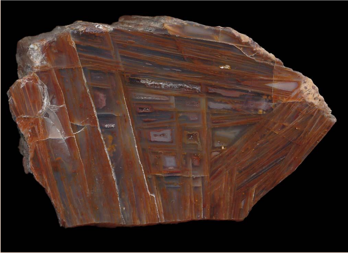
Pseudomorphosen / Pseudomorphs. 8 cm.