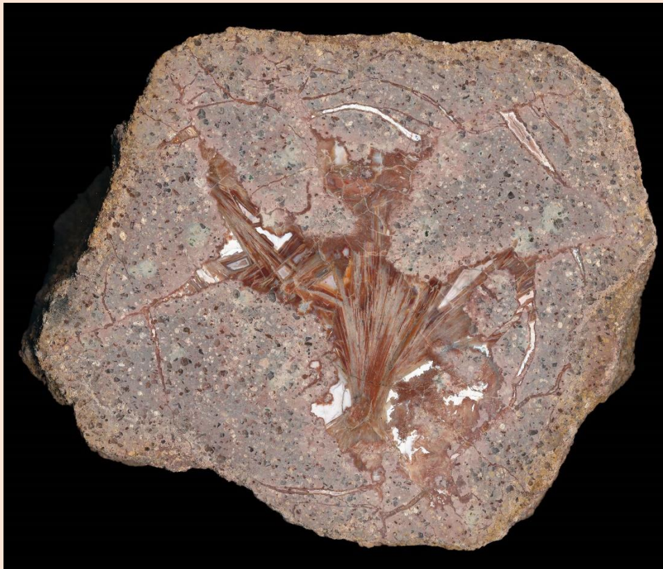
Pseudomorphosen / Pseudomorphs. 16 cm.