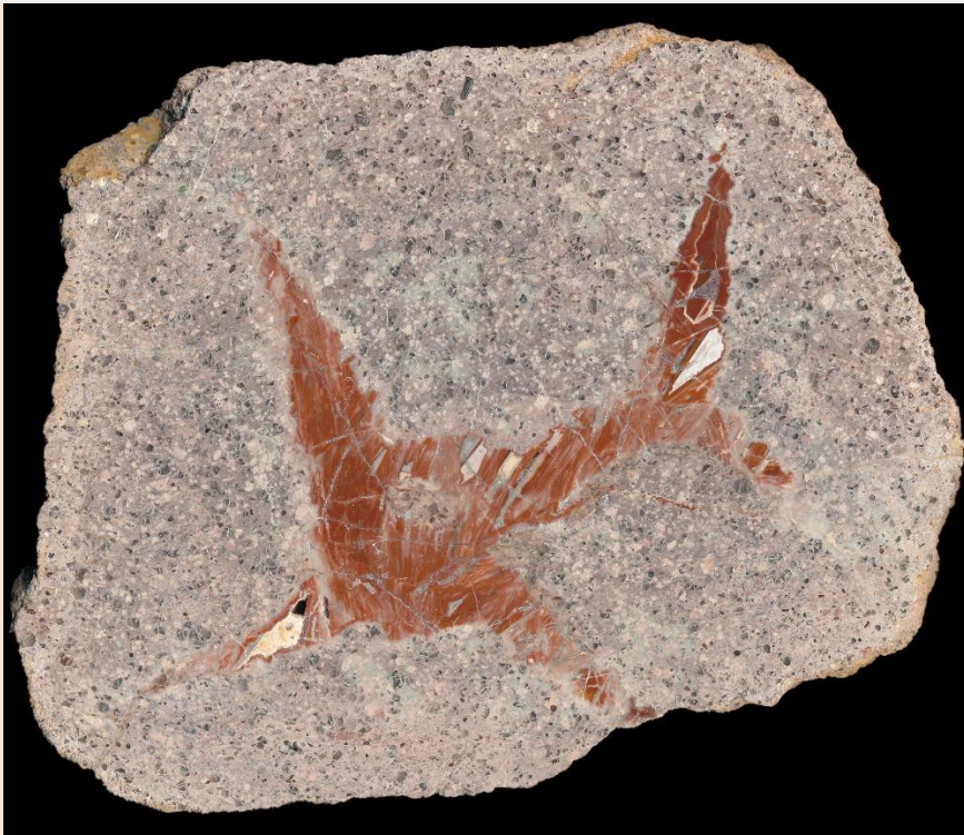
"Fisch" / "Fish". 22 cm.