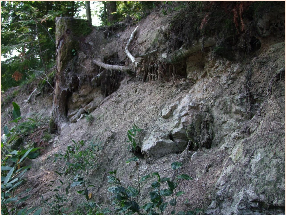
Spuren der alten Abbaue / Remnants of the old diggings.