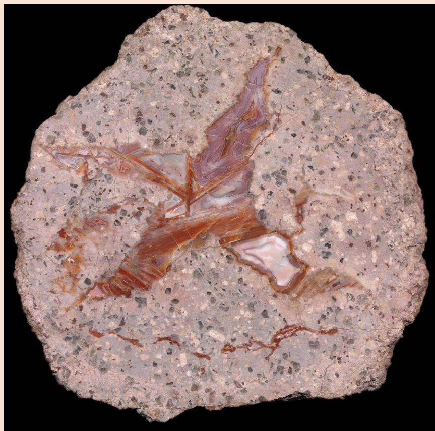
Vielfältige Zeichnung / Different patterns. 10 cm. Patricia & Bernd Hemmer collection & photo.