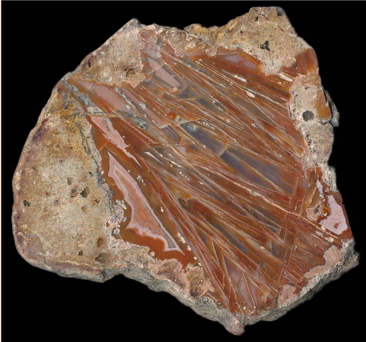
Pseudomorphosen / Pseudomorpha. 6 cm.