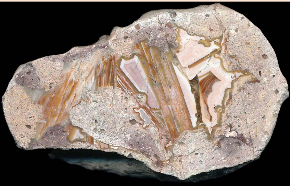
Lebhafte Zeichnung / Vivid pattern. 10 cm.