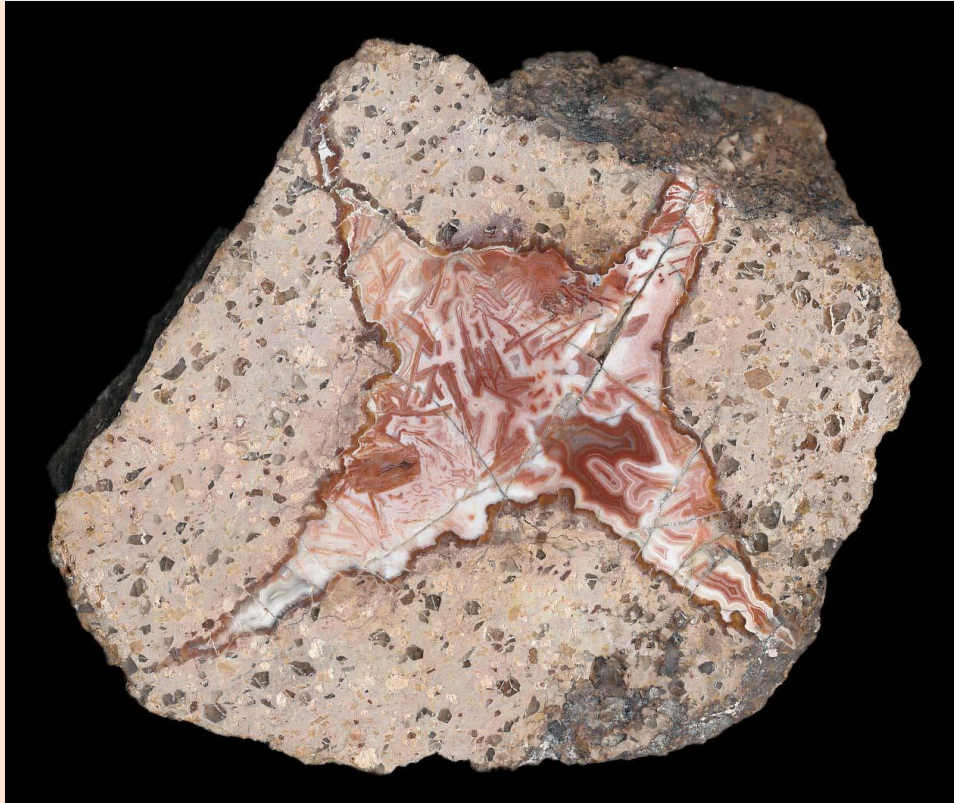
Lithophyse / Thunderegg. 11 cm.