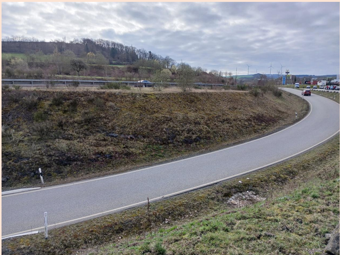
Fischbach-Weierbach. 2026.