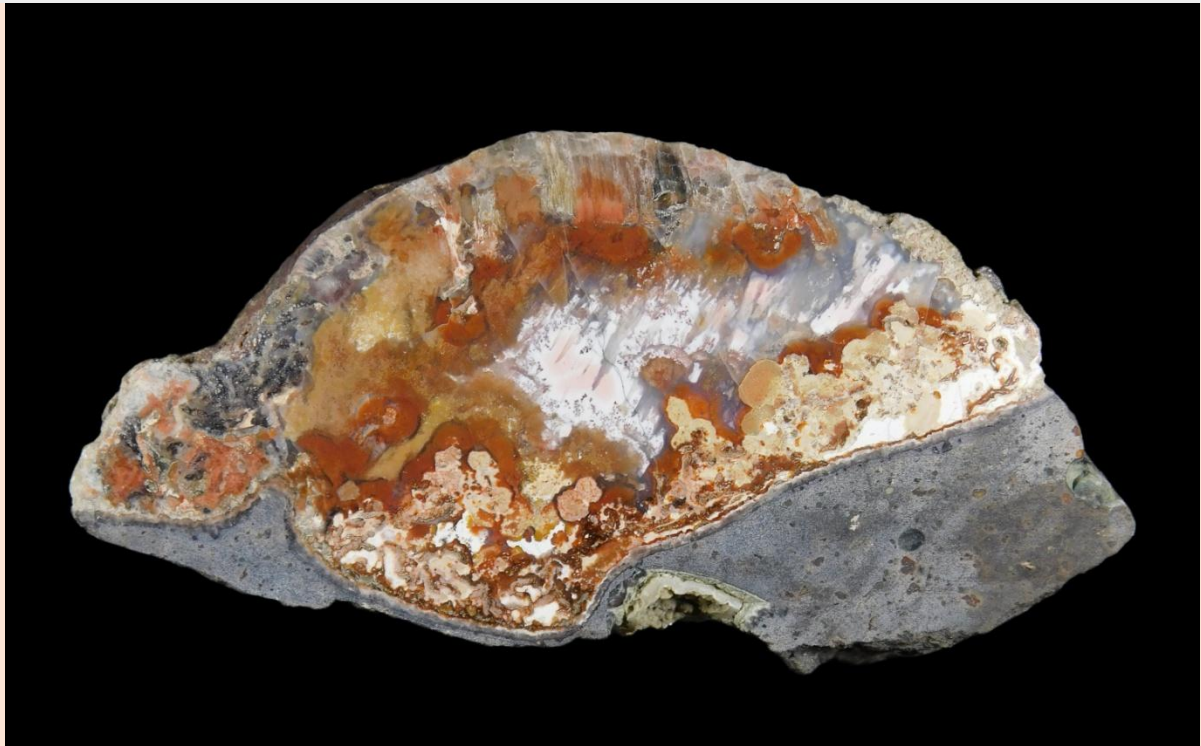
Achat mit etwas Muttergestein / Agate with host rock. B41, Fischbach-Weierbach. 12 cm.