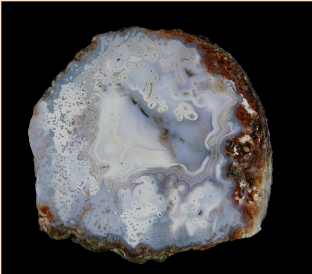
7 cm. Ex-Dietrich Mayer collection.