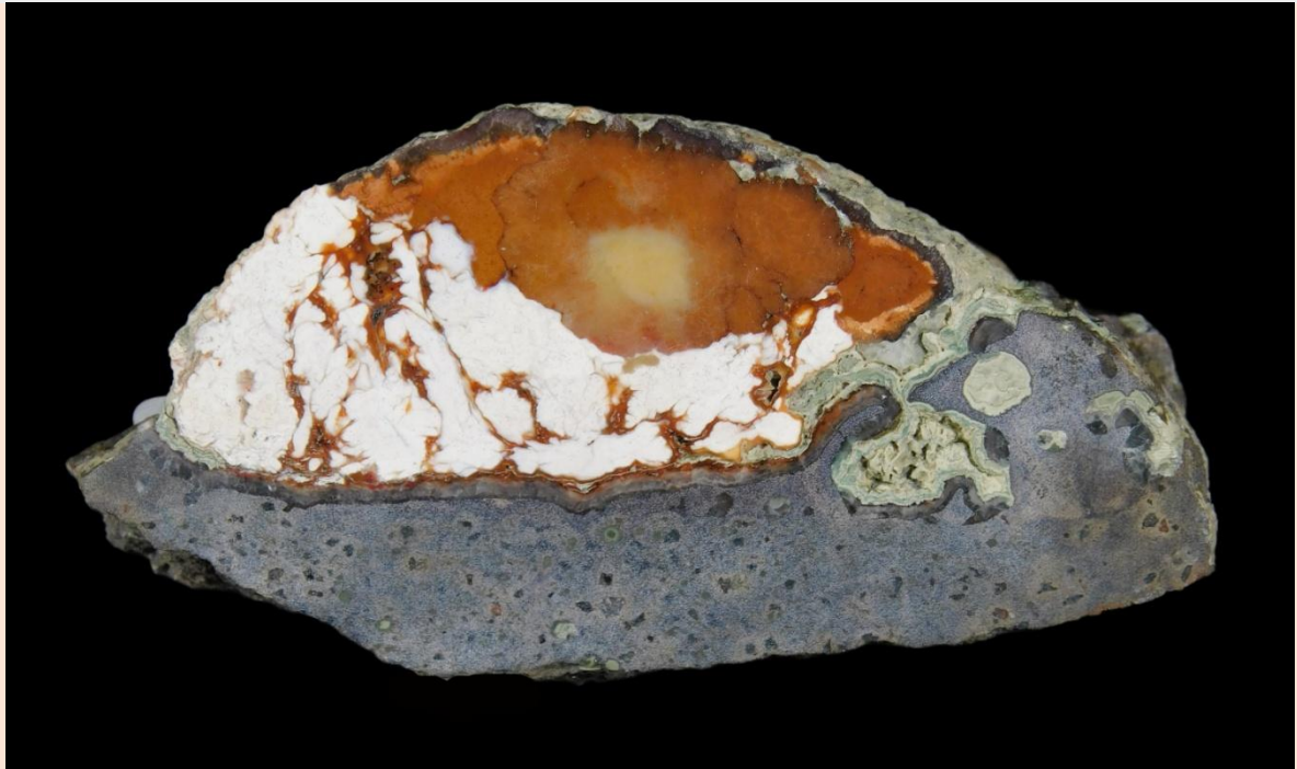
Diese Mandel sitzt noch zum Teil im extrem harten Vulkanitgestein / This nodule is still partially embedded in the extremely hard volcanic host rock. 7 cm.