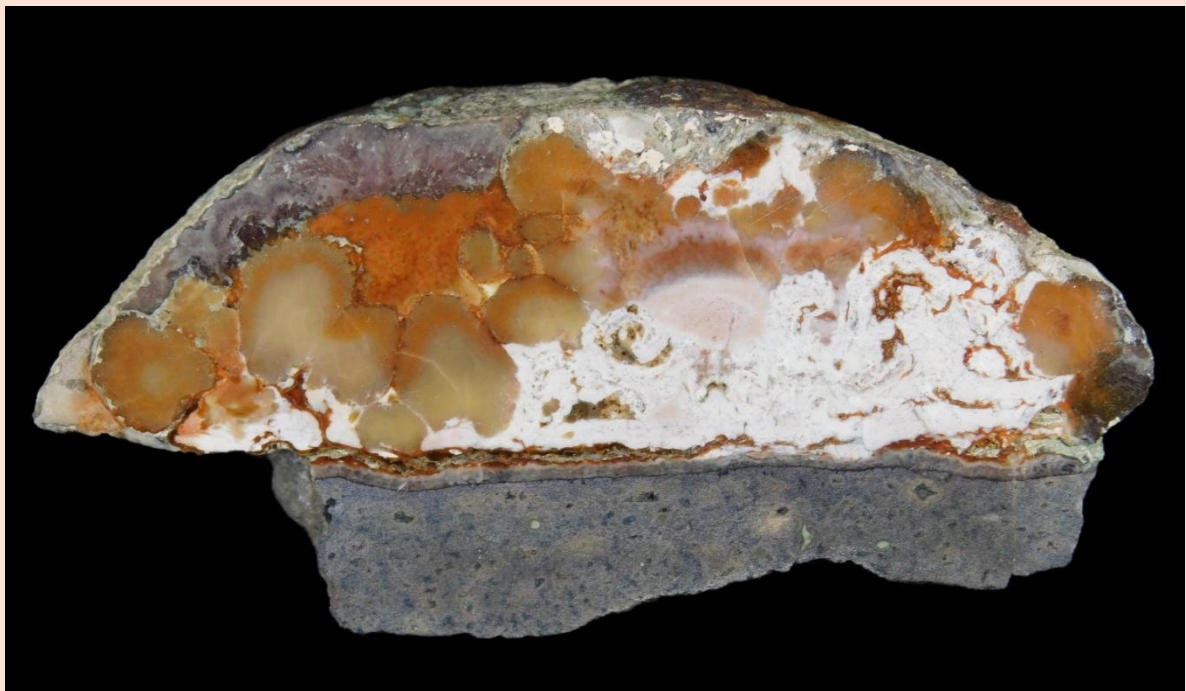
Ungewöhnliche Formen / Unusual patterns. 9 cm.