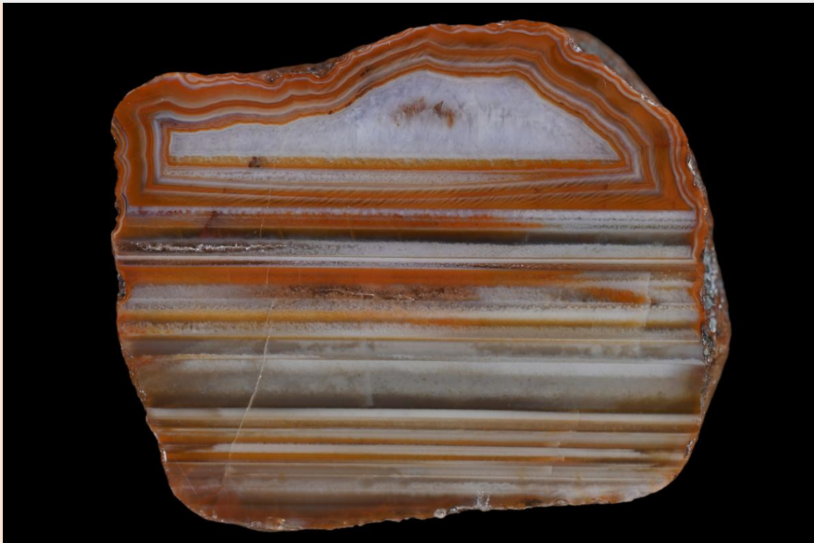
2.8 cm.