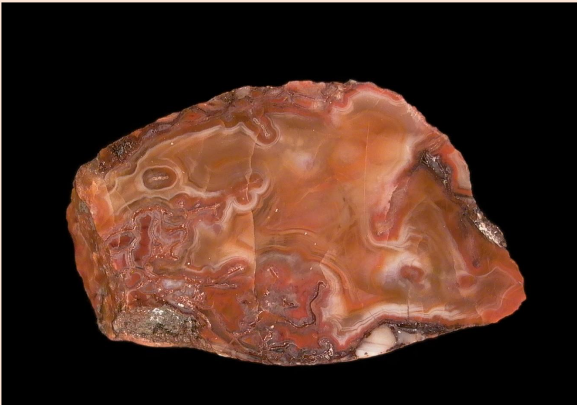
3.5 cm.