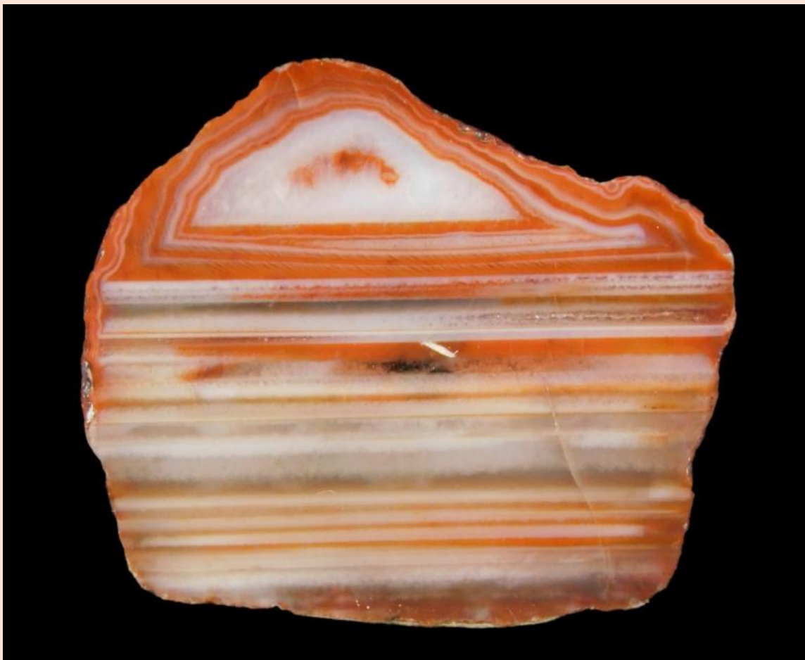
Hälfte 2 von Bild oben / Second half from above. 3 cm.