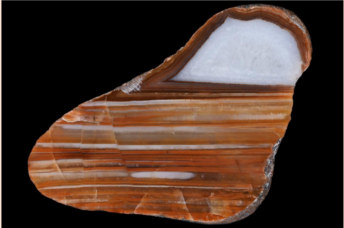
4 cm.