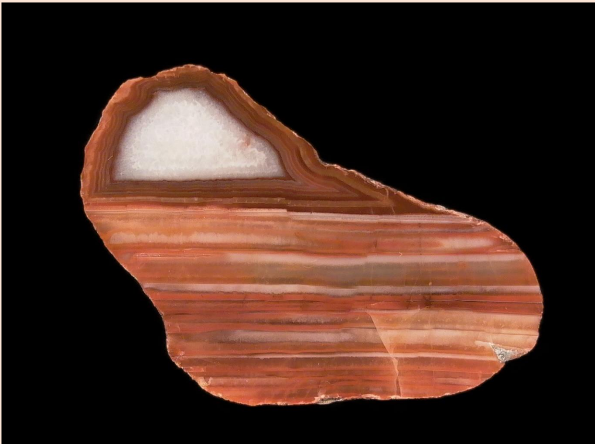
Hälfte 2 von Bild oben / Second half from above. 4 cm.