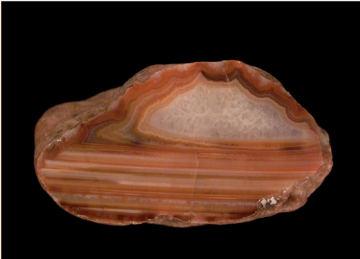
3.5 cm.