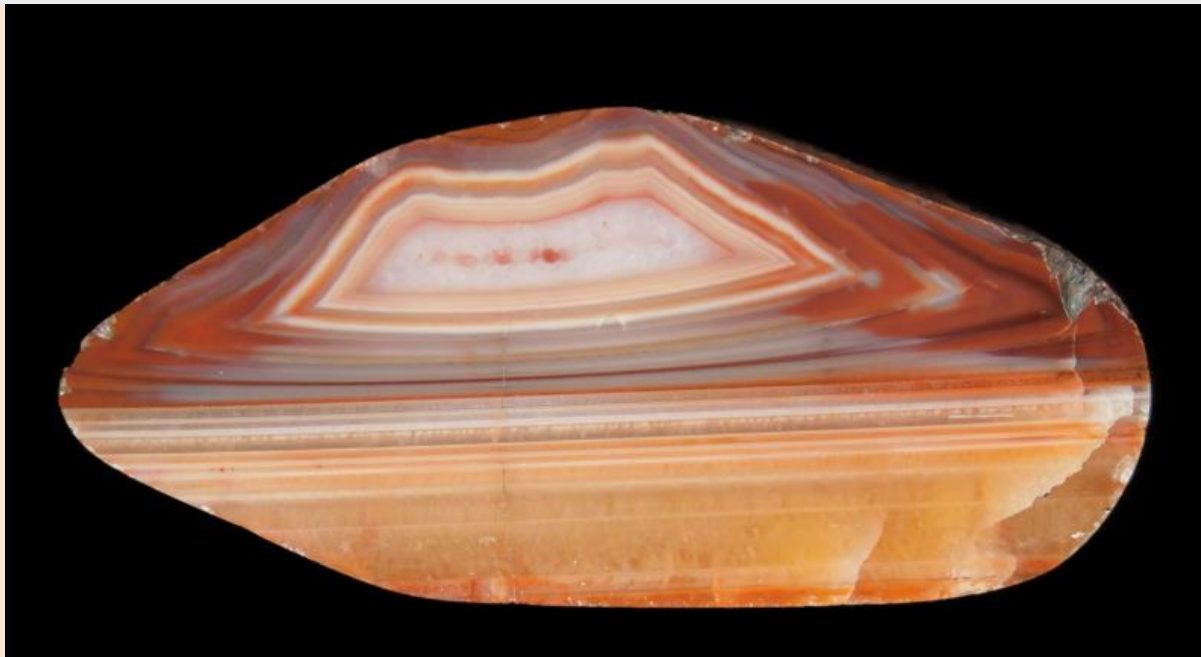
4.8 cm.