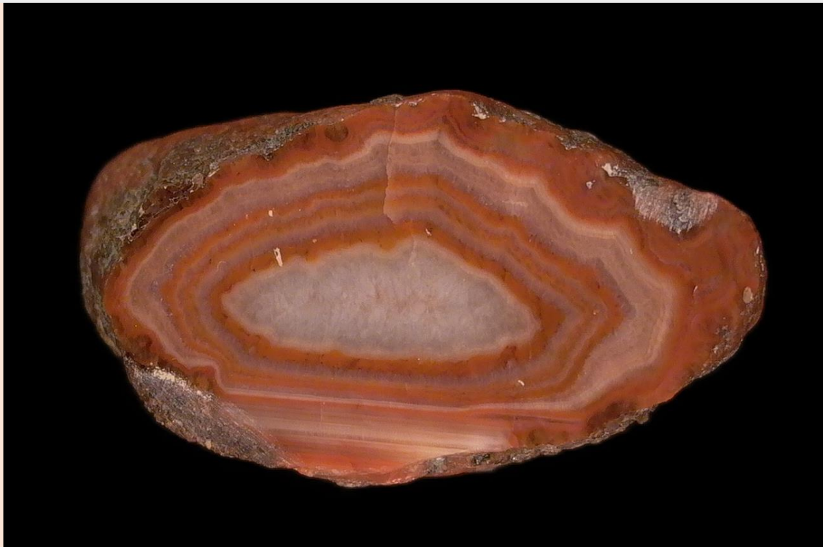
3 cm.