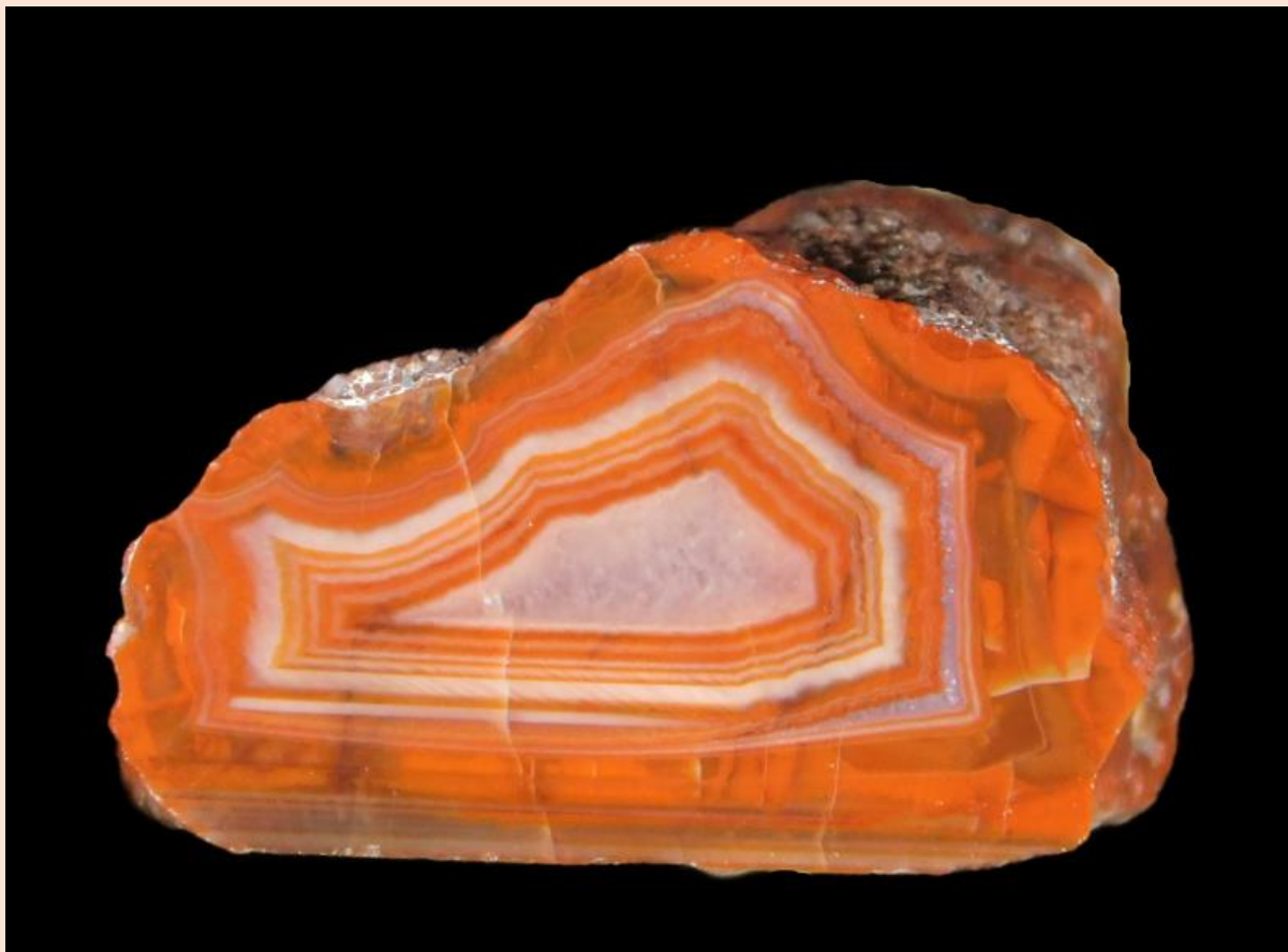
3.6 cm.