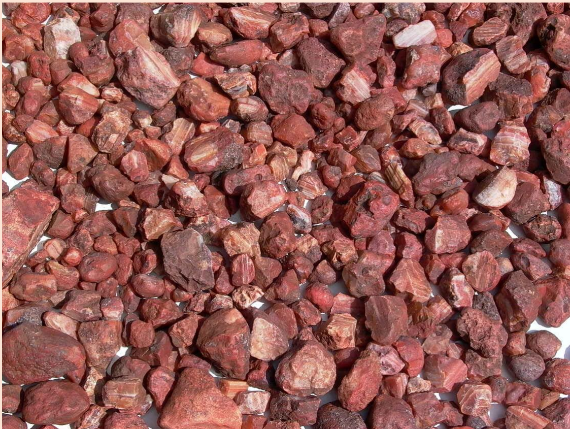
Rohachate in situ und nach dem Aufsammeln / Agate rough in situ and after collecting. Fundstelle 2 / Deposit 2.